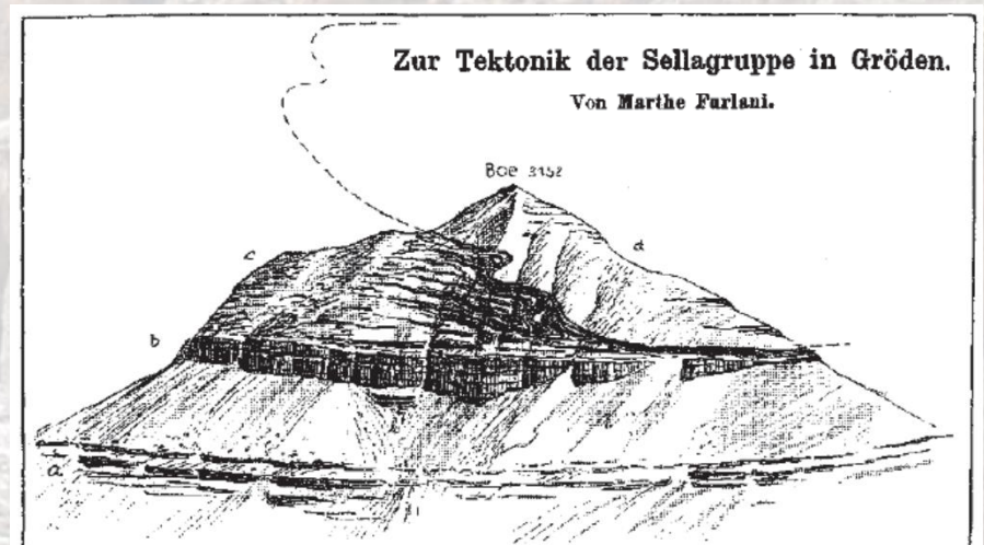
Fig. 3. Boë von P. 2902. gez. H. Rohn. a = Dachsteinkalk c = Acanthieuskalk b = Kalkbrekzie u. grüner Dolomit d = überschobener Dachsteinkalk b = Grauer Kalk

Mitteilungen der Geologischen Gesellschaft in Wien 2, 1909